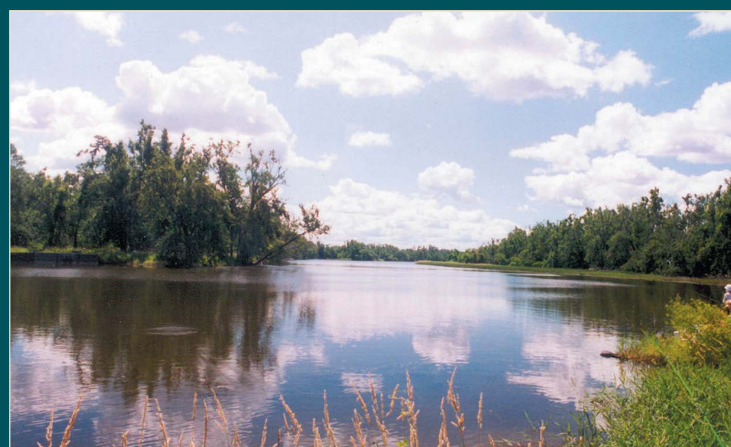
Missisquoi River/USFWS - Rivière Missisquoi/USFWS