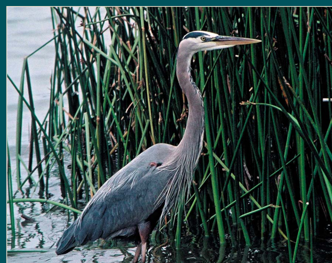
Great Blue Heron/USFWS - Grand héron/USFWS

Plenty of water, sun screen and bug repellent in the hot summer months. Dress appropriately for the day's weather.